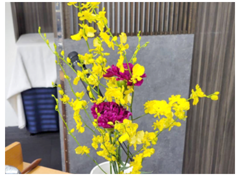
カーネーション(南ヨーロッパ) 花言葉(無垢で深い愛) オンジューム(中南米) 花言葉(一緒に踊って・気立てのよさ・清楚)