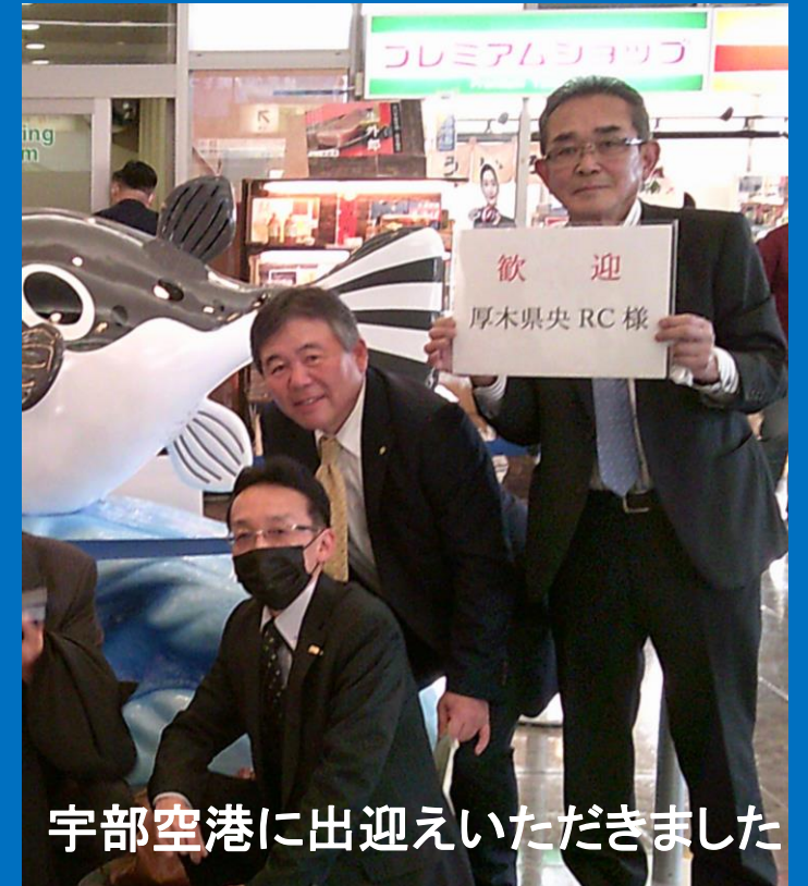
宇部空港に出迎えいただきました