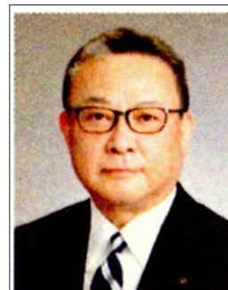
第2780地区 2022年-2023年度ガバナー

「ImagineRotary」：イメージしましょう ポリオの無い世界、みんなが安全な水を使える世界、疾病の無い世界、全ての子供が読むことのできる世界、やさしさ、希望、愛、平和を想像しましょう！ ひとり一人、あらゆる全ての会員が役割を持ち、楽しんで積極的に参加できるクラブの結集でこそ実現に近づきます。ロータリーはクラブが原点です。そしてひとり一人の会員が大切です。もっと学び、それぞれの能力を活かし、クラブの力を合わせてイメージした世界の実現を目指しましょう。