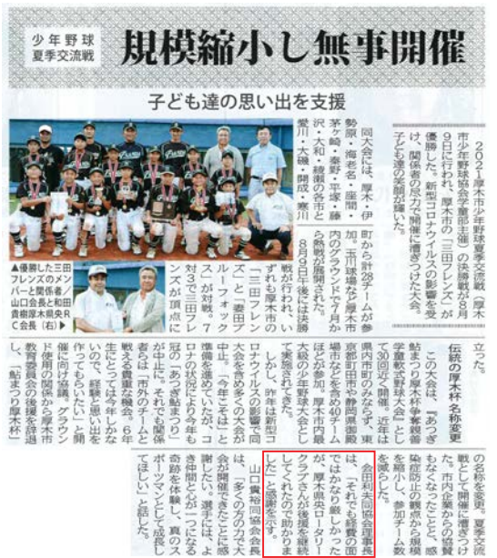
タウンニュース 8月 20日号に掲載