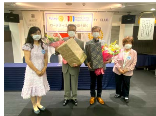
会長幹事に記念品贈呈