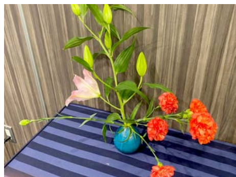
百合(北半球の温帯地域)