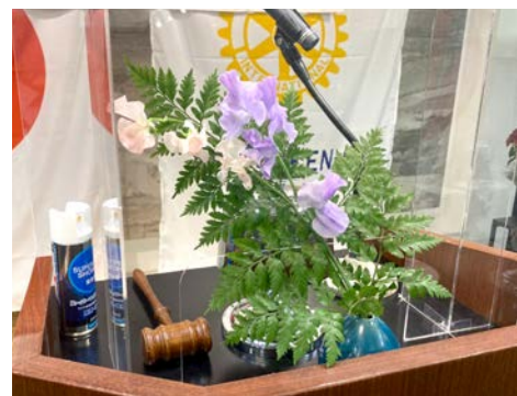
スイートピー(イタリアのシシリー島) 花言葉(門出・繊細)