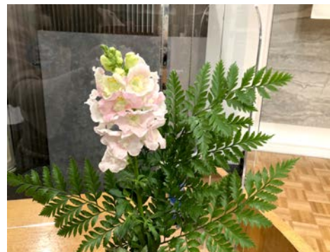
金魚草(南ヨーロッパ)