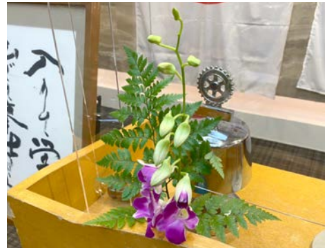
デンファレ(東南アジア・アオセアニア) 花言葉(有能・魅惑・お似合いのふたり)