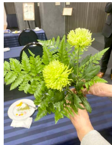
菊〈アナスタシア〉(中国)