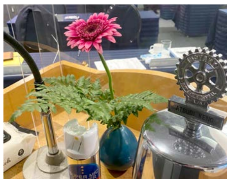
ガーベラ (南アメリカ)