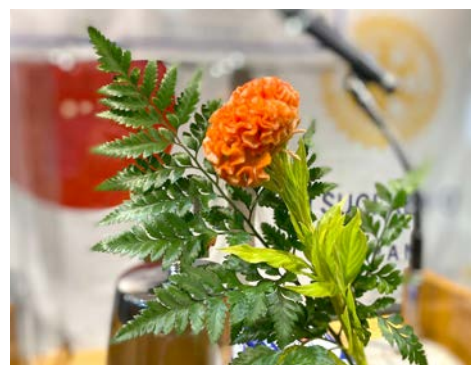
ケイトウ(アジア・アフリカの熱帯地方) 花言葉(おしゃれ・気取り・風変り)