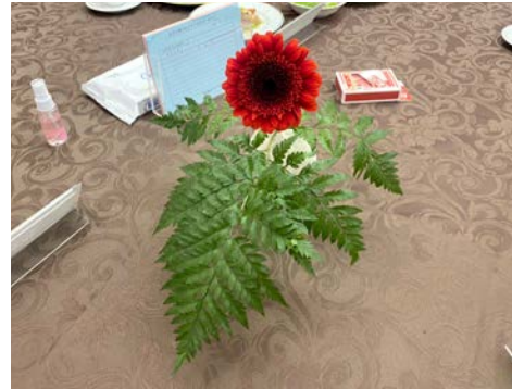
ガーベラ (南アフリカ) 花言葉 (希望・常に前進・神秘)