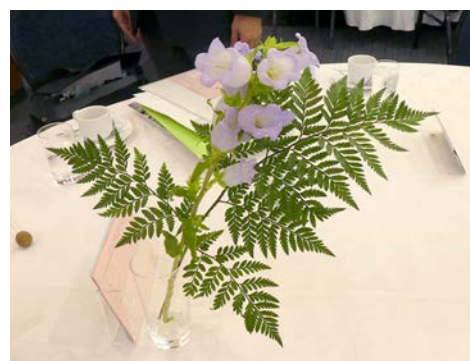
カンパニユラ(ヨーロッパ) 花言葉(感謝・共感・節操)