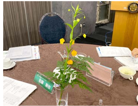
サンダーソニア(南アフリカ) 花言葉(望郷・祈り)